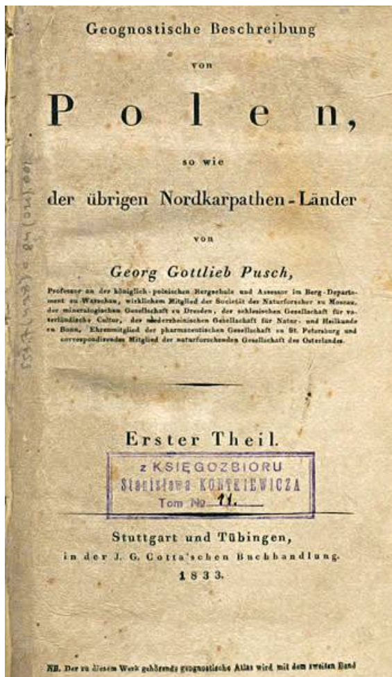
Strona tytułowa pierwszego tomu „Geognostische Beschreibung von Polen...”. Egzemplarz ze zbiorów biblioteki Oddziału Świętokrzyskiego Państwowego Instytutu Geologicznego w Kielcach

uczonego. To w ciągu tych 10 lat zebrał materiały do wspomnianych wyżej prac. Złożyły się na nie niezliczone obserwacje geologiczne w okolicy Kielc, w promieniu 10 mil i wyniki 15 wypraw badawczych w odleglejsze strony Polski. Dodajmy, że korzystając z faktu, iż granice geologiczne nie pokrywały się z granicami politycznymi Pusch badał i opisywał budowę geologiczną obszaru mieszczącego Polskę w jej historycznych granicach.